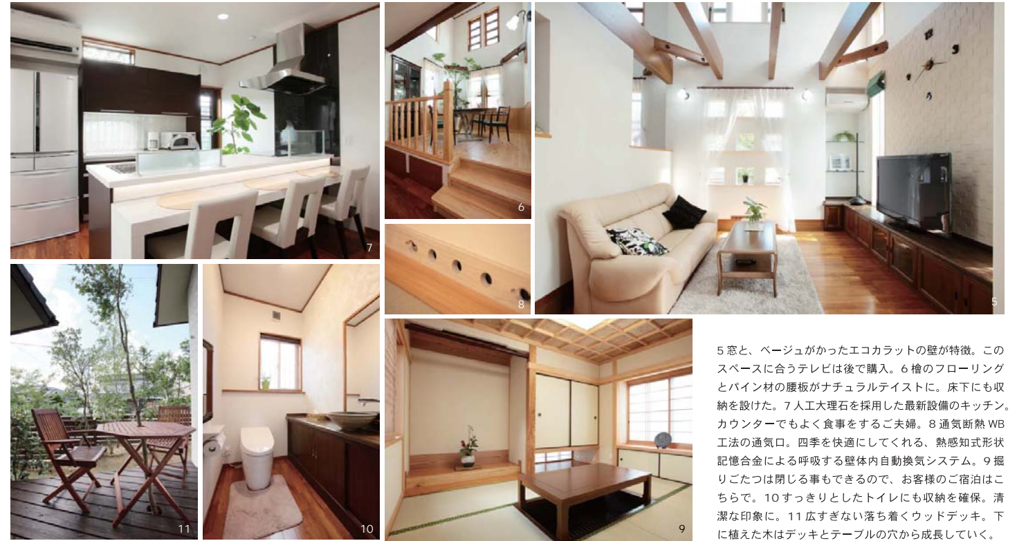
5 窓と、ベージュがかったエコカラットの壁が特徴。このスペースに合うテレビは後で購入。6 檜のフローリングとパイン材の腰板がナチュラルテイストに。床下にも収納を設けた。7 人工大理石を採用した最新設備のキッチン。カウンターでもよく食事をすごすご夫婦。8 通気断熱WB工法の通気口。四季を快適にしてくれる。熱感知形状記憶合金による呼吸する壁体内自動換気システム。9 掘りごたつは閉じる事もできるので、お客様のご宿泊はこちらで。10 すっきりとしたトイレにも収納を確保。清潔な印象に。11 広すぎない落ち着いたウッドデッキ。下に植えた木はデッキとテーブルの穴から成長していく。