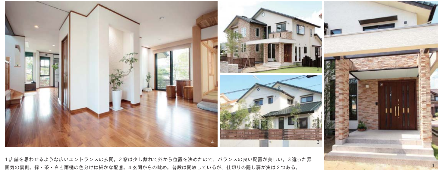
1 店舗を思わせるような広いエントランスの玄関。2 窓は少し離れて外から位置を決めたので、バランスの良い配置が美しい。3 違った雰囲気裏側。緑・茶・白と雨樋の色分けは細かな配慮。4 玄関からの眺め。普段は開放しているが、仕切りの隠し扉が実は2つある。

「一緒に芸術作品を創っているようだった」 ご主人：自分で方眼紙に20通りくらい間取りを書いて、橋本さんに見てもらいました。考えている時は、良いものができそうだなという期待もあったんですけど、階段を真ん中に持つてくる思い切った設計だから勇気がいりました。吹き抜けもあるし、冷暖房は大丈夫かなって不安もありましたね。 橋本さん：ご主人の描かれた間取りを見た時は、変わってるなと思いました。でも、よしやってみよう！ とすぐに決めました。家に対する夢や熱い思いをお持ちだったので、余計にお応えしたいという気持ちになりました。不安な部分はご納得いくまでご相談に応じます。