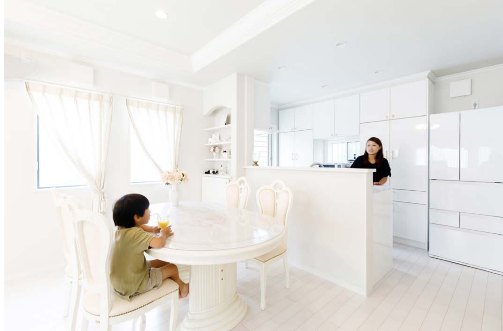
和室までも目が届くキッチンを中心に動きやすい動線も配慮。家事がぐっと楽になった