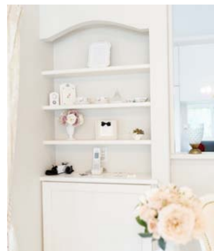
(上)天井はモールを使用することで高さを演出。バルーンカーテンは奥さまが厳選したお気に入りだ (右)ダイニングの壁にはニッチを製作。上部はリビングのドアに合わせてアールをつけた (中)階段は2階の応接室に玄関からすぐ上がるように間取りを配置 (左)ダークブラウンの重厚感のあるドア

奥さまはこの家が出来てから掃除も家事も楽になり、子どもを見守りながらご趣味のボウセラーズを楽しむ時間も増えた。好きなものに囲まれ、暑い時期は暑さがこもらず、冬は断熱するWB工法の空間は、気づけばどこよりも落ち着ける場所になっていた。