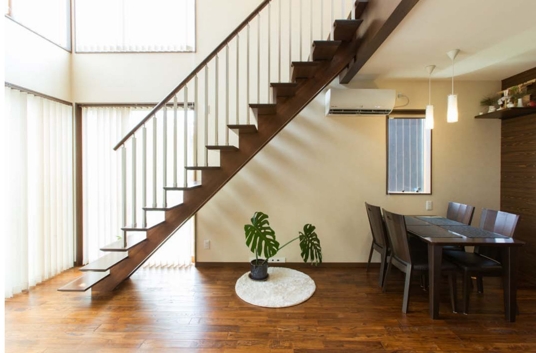
仕切りのない階段や吹き抜け構造、高い天井・ドア、十分な採光でリビングは面積以上に広く感じられる